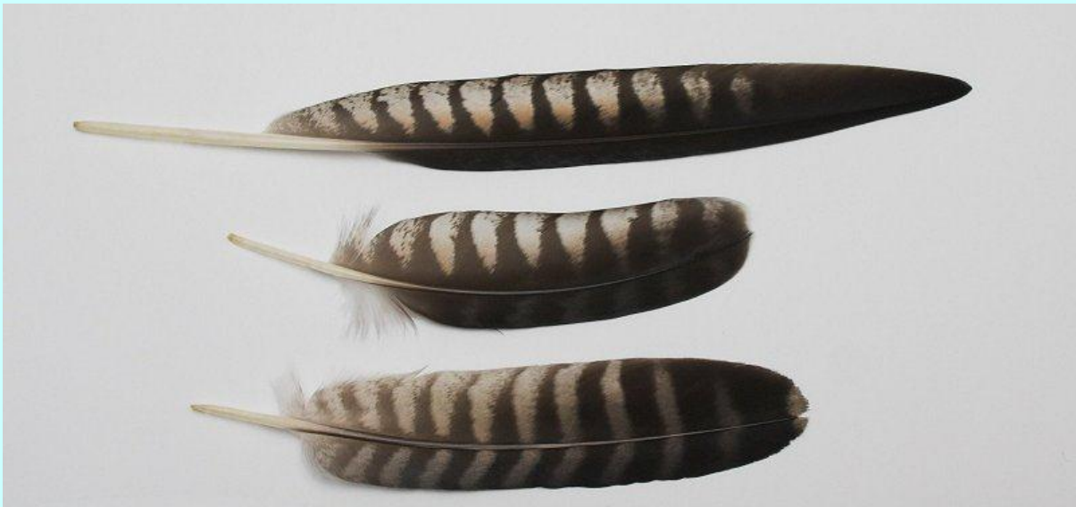
Serie ruipennen: handpen - armpen - staartpen